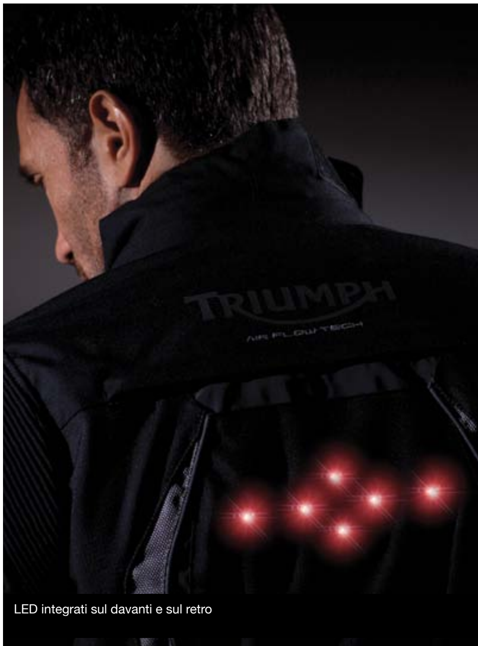
LED integrati sul davanti e sul retro