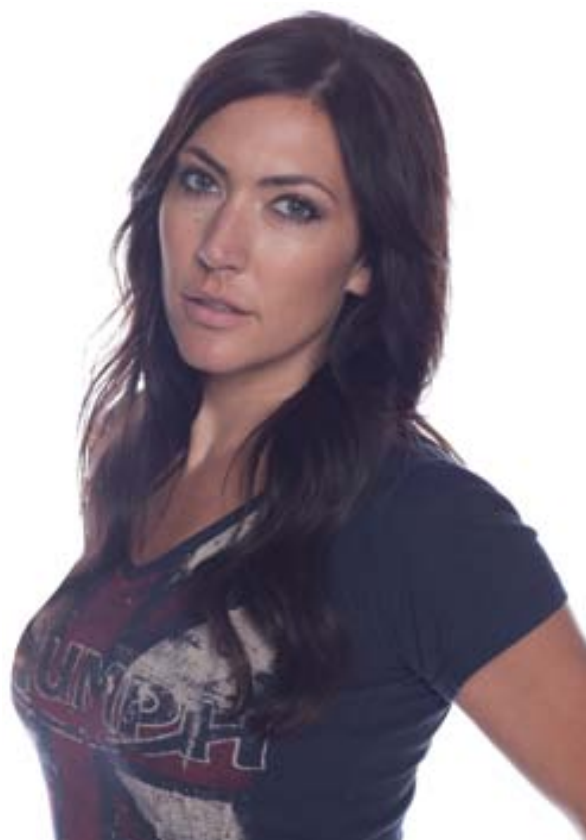
T-Shirt Navy Union Flag 100% single jersey con collo a "V" e stampa invecchiata