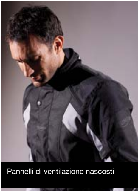
Pannelli di ventilazione nascosti