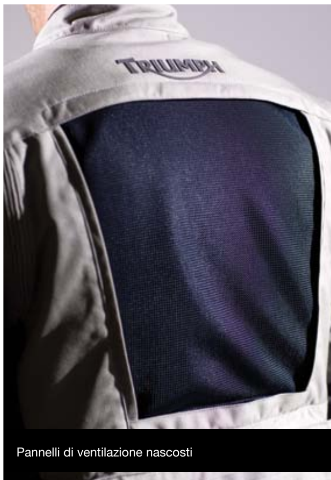
Pannelli di ventilazione nascosti