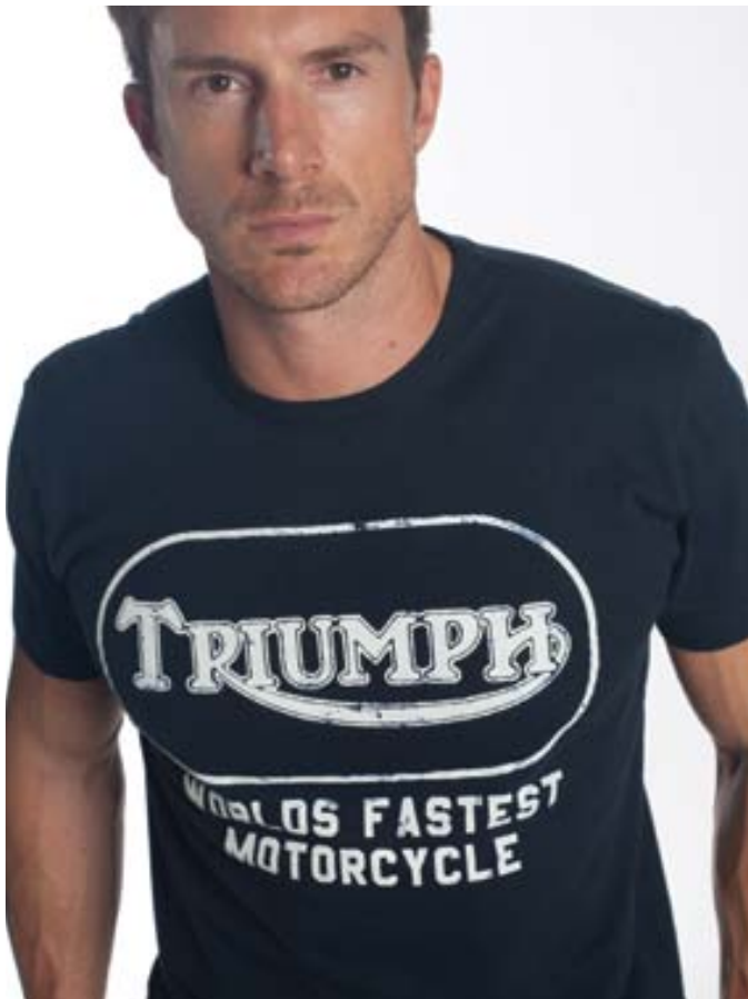
T-Shirt World's Fastest 100% single jersey con stampa a pigmento