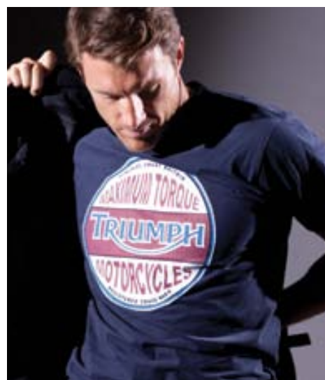
T-Shirt Maximum Torque

100% single jersey con stampa invecchiata