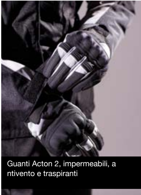
Guanti Acton 2, impermeabili, antivento e traspiranti