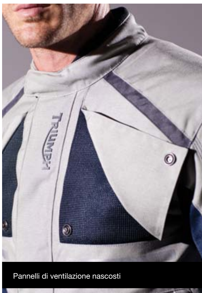
Pannelli di ventilazione nascosti