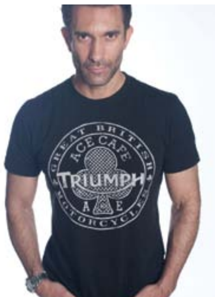
T-shirt Ace Cafe

Il rider indossa giacca Ace Café, t-shirt Ace Café, jeans Denim Vintage, stivali Gratham e guanti Edmonton