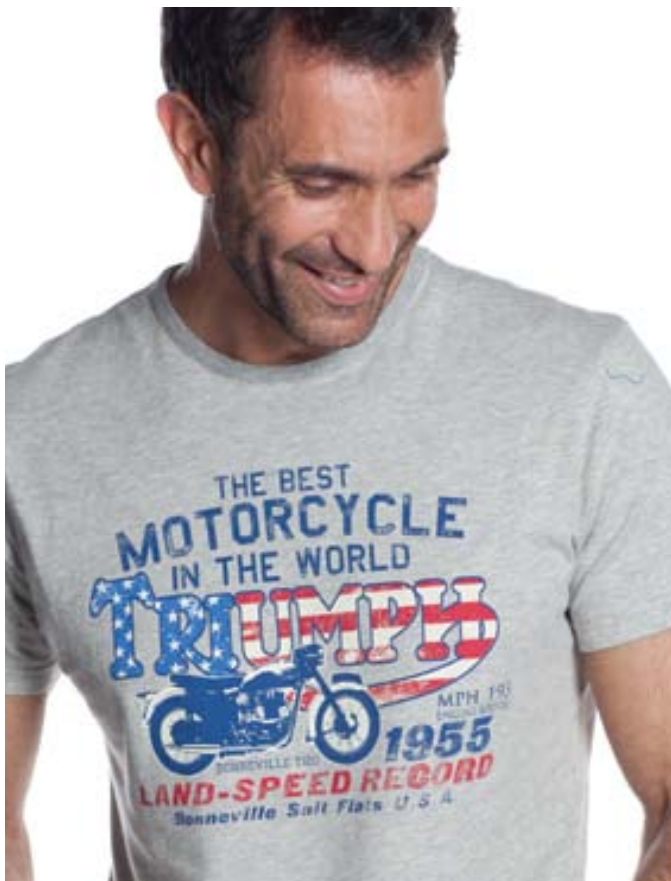
T-Shirt Land Speed 100% single jersey con stampa a pigmento