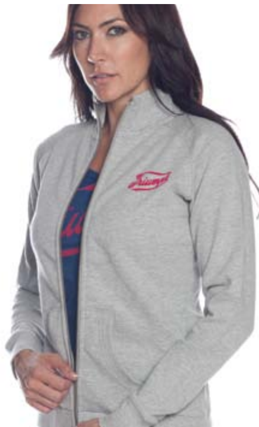
Script Zip Thru 100% cotton zip thru with a flock print logo design