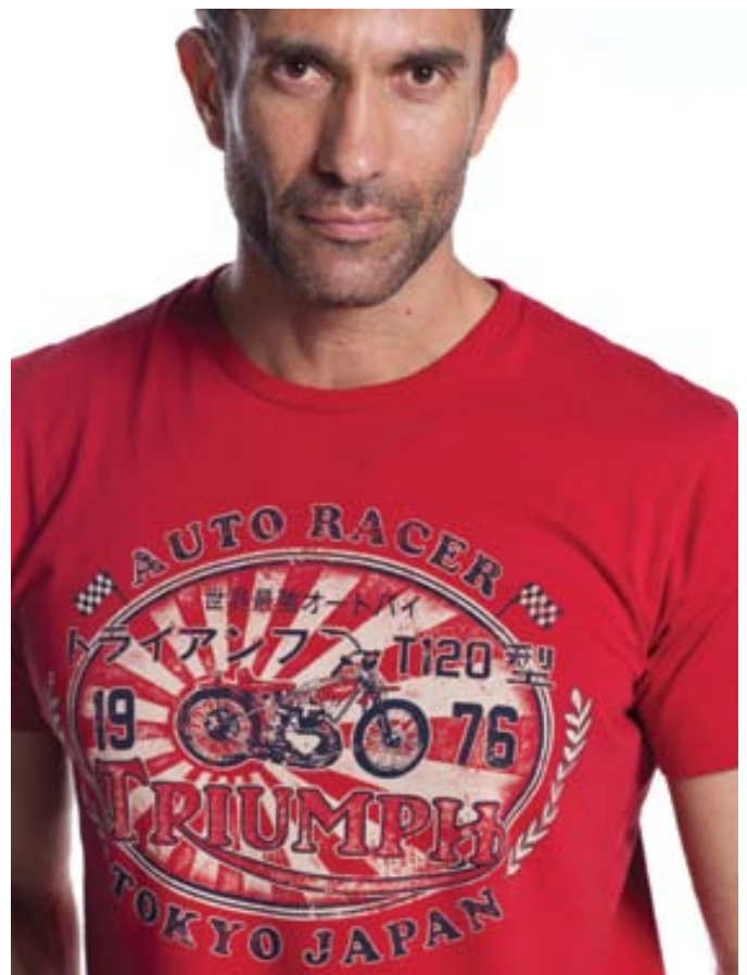
T-Shirt Japanese Auto Racer 100% single jersey con stampa invecchiata