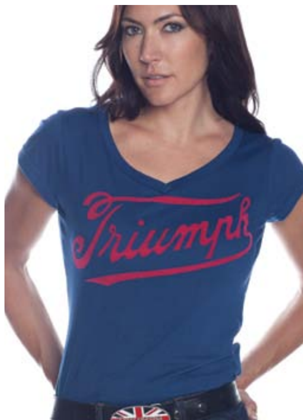
T-Shirt Logo Script 100% single jersey con collo a "V" e stampa floccata