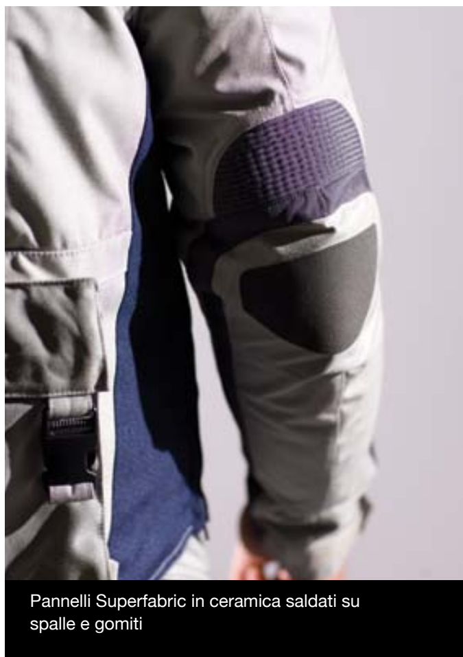
Pannelli Superfabric in ceramica saldati su spalle e gomiti