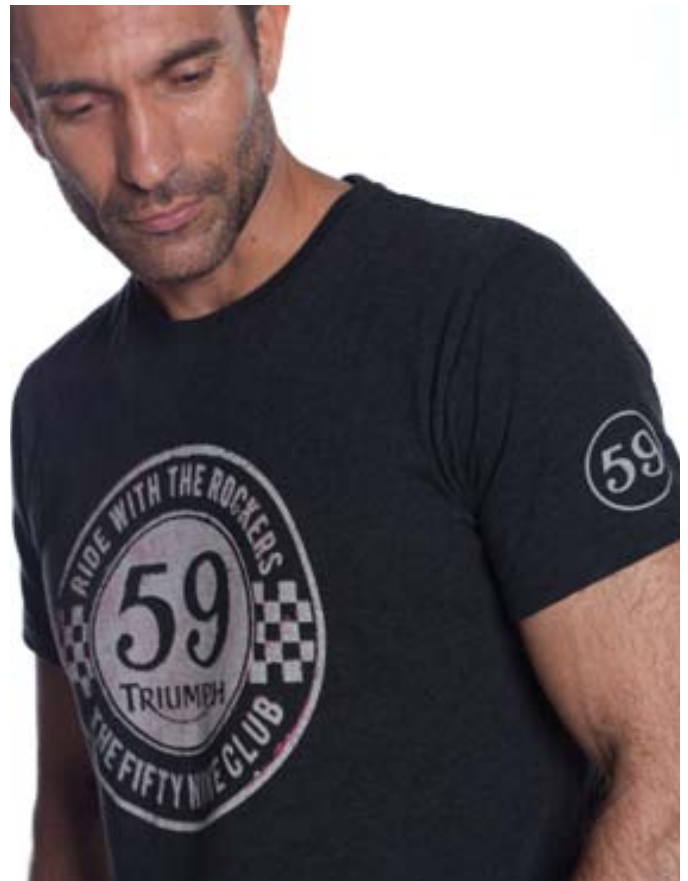
T-Shirt 59 Club 100% single jersey