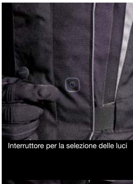
Interruttore per la selezione delle luci

Il rider indossa giacca Light Sympatex®, pantaloni Sympatex®, stivali AS3 Gore-Tex® e guanti Explorer.